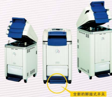
全新的脚踏式开关