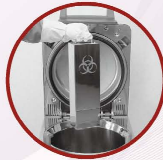
垂直放在高压灭菌锅内灭菌