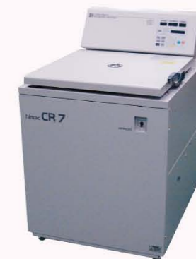
大容量血液分离转头R5S3