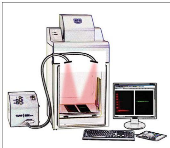
图 3 连接有 BioLite 的 BioSpectrum 系统

注：BioSpectrum 和 BioLite 组成一个强大的组合，取决于使用的滤光片，能专一地获得激发光（365-765 nm）和 400-850 nm 的发射光。在同一个试验中，可以最多获得 8 个激发波长和 5 个发射波长