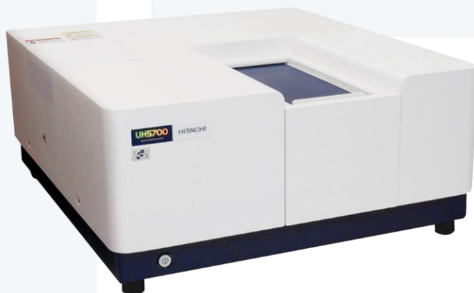
图 1、HITACHI 紫外可见近红外分光光度计 UH5700