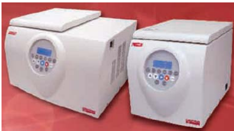
V14/14R (常温/制冷型, 最高转速: 14,000 rpm )