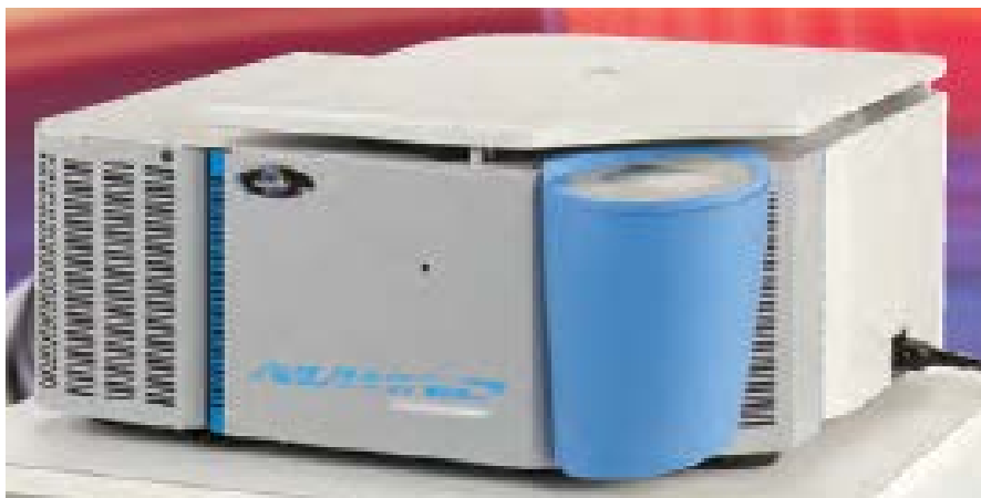
NU-C200R, 制冷型 也有常温型可选