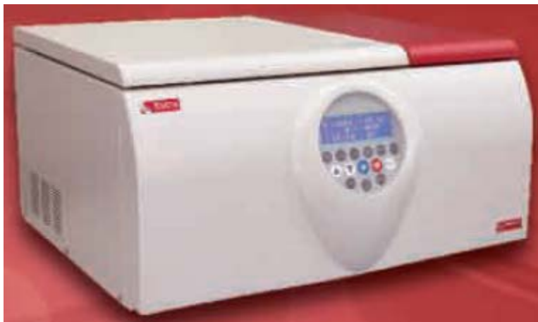
V18R (制冷型, 最高转速: 18,000 rpm )