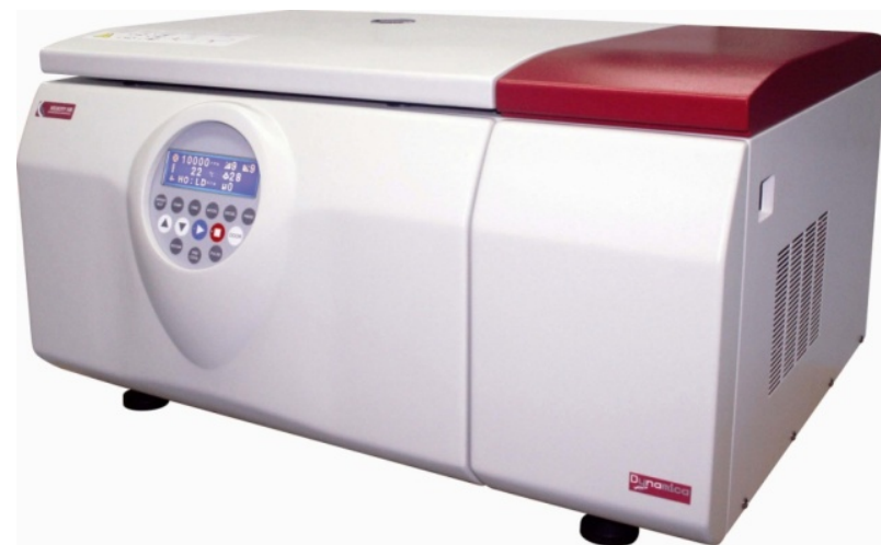
V10R ( 最高转速: 10,000 rpm )