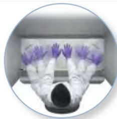
[ Larger Work Area ]