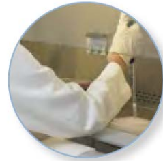
[ Recessed Airfoil Grill and elbow rest accessory ]