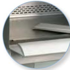
[ Disposable Arm Rest Pads ]